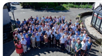
Delegierte & Gäste der Jährlichen Konferenz